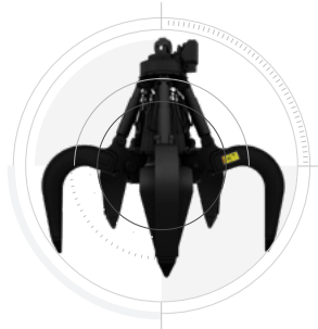
GSV – MEHRSCHALENGREIFER