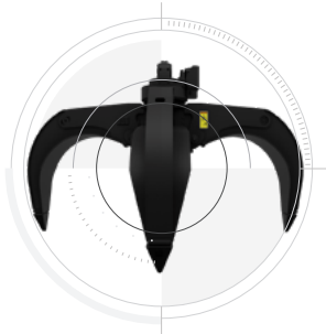
GSH – MEHRSCHALENGREIFER